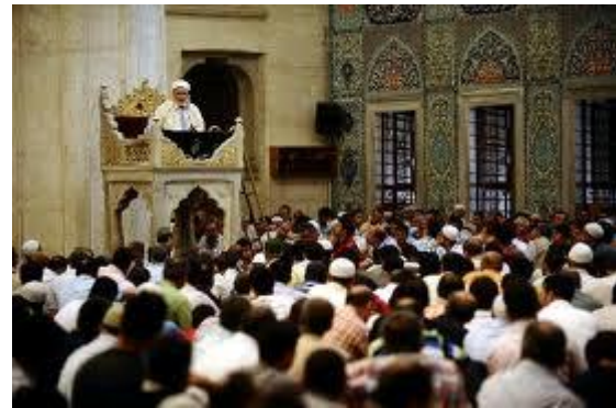
การอ่านธรรมเทศนาหลังละหมาด